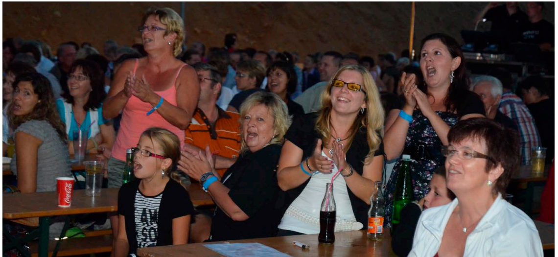
Das Publikum genoss die gute Stimmung beim Konzert im neuen „Stone Stage“ in Limberg.

Wieder einmal in diesem Jahr machte das Wetter bei der einen oder anderen Veranstaltung einen Strich durch die Rechnung. Einerseits kamen wir im Bezirk Hollabrunn glimpflich davon, wenn man Berichte aus anderen Regionen verfolgt. Jedoch ist es jedem Veranstalter zu raten, schon vor der Veranstaltung den Weg ins Trockene zu planen. Die Unwetter kommen heuer unglaublich schnell und heftig. Bei der Theatervorstellung in der Ruine Kaja sorgte das Unwetter für noch mehr Spannung. Noch dazu wurde hervorragend improvisiert.