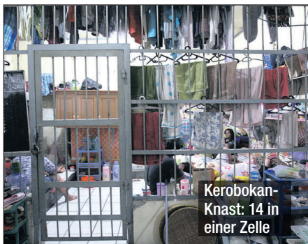
Kerobokan-Knast: 14 in einer Zelle