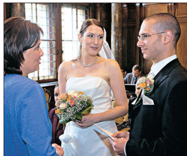
Paare brauchen keine Trauzeugen mehr.

Nahezu unbemerkt trat eine wichtige Änderung für Heiratswillige in Kraft: Seit 1. November des Vorjahres sind am