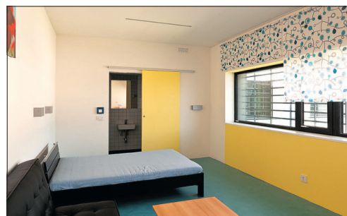
Hat Hotelzimmer-Standard: eine Kuschelzelle im Knast