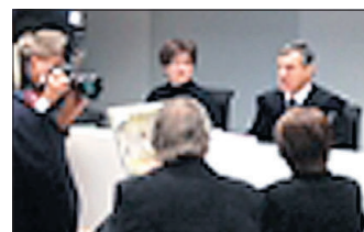
Vor Gericht: Bankerin und Ehemann

Über 30 Jahre stahl eine burgenländische Bankangestellte (58) regelmäßig Geld von Kundenkonten und besserte sich so ihr Monatsgehalt um bis zu 3.300 Euro auf. Dafür stand sie Mittwoch in Eisenstadt vor Gericht und wurde (nicht rechtskräftig) zu dreieinhalb Jahren Haft verurteilt. Gegen ihren Mann wird noch wegen Geldwäsche verhandelt ■