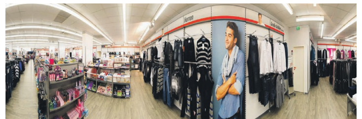
Die KiK-Filiale in Hollabrunn wird am 22. Mai 2014 wiedereröffnet und erstrahlt in neuem Glanz.

Stockerauerstraße 155, 2100 Leobendorf Tel.: 02262 / 66567, techn. Hotline 0900 / 370955 elektrowieser@gmx.at, www.elektrowieser.at Durchgehend geöffnet: Mo. - Fr. 8-17 Uhr